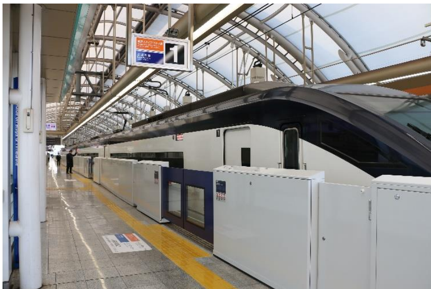
ホームドアイメージ(写真は日暮里駅ホームドア)