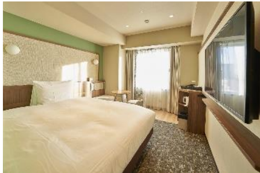
●コーナースーペリアルーム