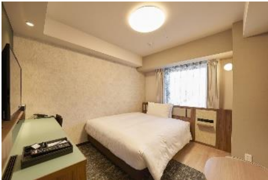
●モデレートルーム