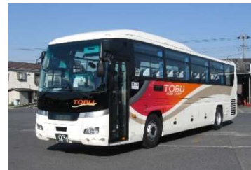
東武バスセントラル

当路線は、近年急速に発展し続けている「柏の葉」、子育て世帯から住みやすい街として注目を集めている「流山おおたかの森」と東京駅を乗り換えなしで繋ぐ新路線です。