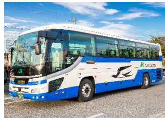
ジェイアールバス関東