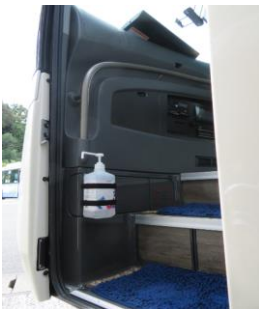
アルコール消毒液