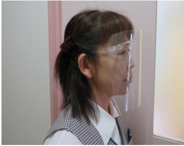
フェイスシールド