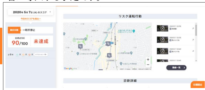
AIとドライブレコーダーの機能を活用して交通事故削減を支援する「DRIVE CHART」

「DRIVE CHART」は、街を縦横無尽に走行するタクシーや営業車、走行距離の長いトラックなど、プロの現場で多く採用される交通事故削減支援サービスです。従来のドライブレコーダーは録画が主な機能でしたが、「DRIVE CHART」は AI を活用し、運転の癖や気の緩みの他、脇見・車間距離不足・一時不停止・速度超過・急ハンドル・急加速・急減速・急後退など交通事故に繋がる可能性の高いリスク運転行動を自動検知し、衝撃や衝突警報などはリアルタイムでドライバー及び運行管理者に通知されます。その他の検知項目に関してもレポートに記録され、ドライバー自身と運行管理者は、場所と動画でリスク運転を振り返ることが可能となります。