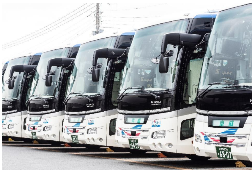
Free Wi-Fi を導入する観光バス

Free Wi-Fi を利用でき、ますます快適になったバスの旅「京成観光バスツアー」、「京成バスシステム」の観光バスを是非ご利用ください。