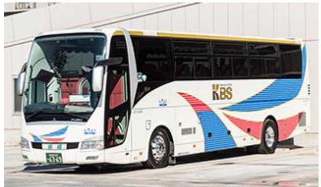
Super Wing プレミアムクラス