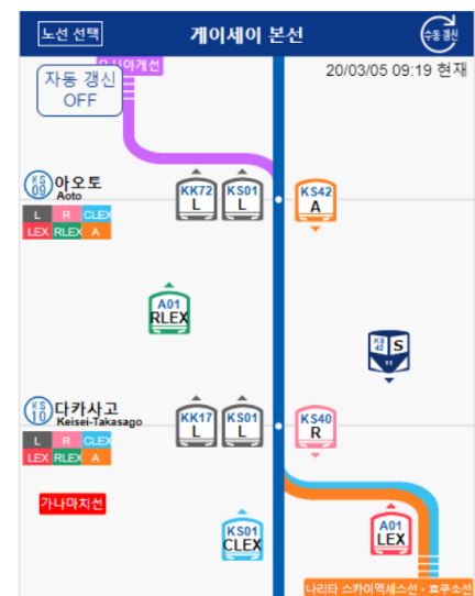
列車走行位置ページイメージ(韓国語)