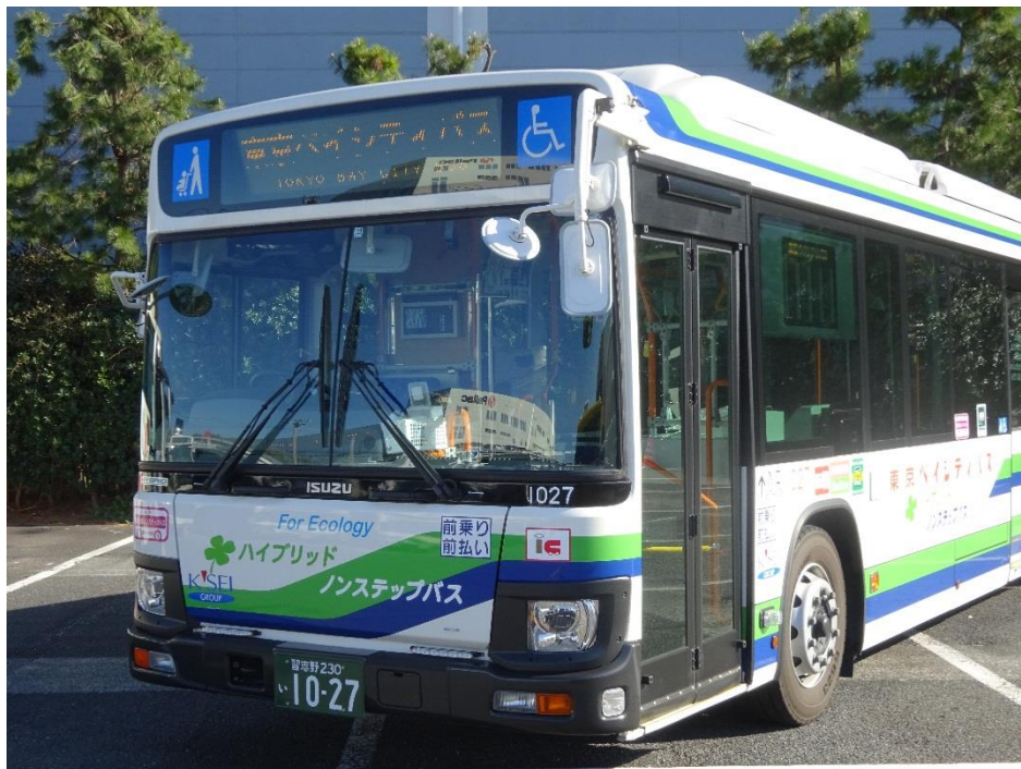
路線バスで使用する車両(一例)