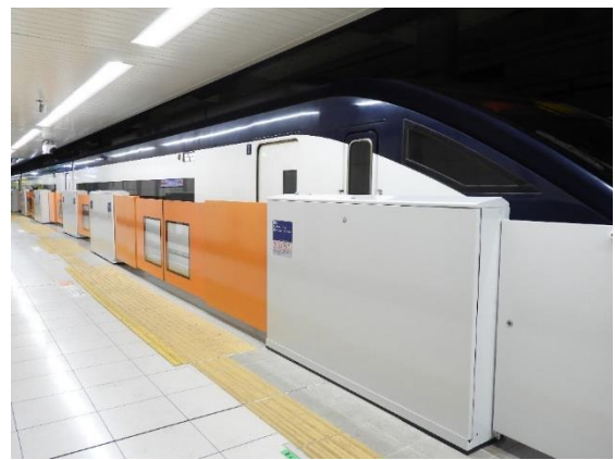
ホームドアイメージ(左:日暮里駅、右:空港第2ビル駅)