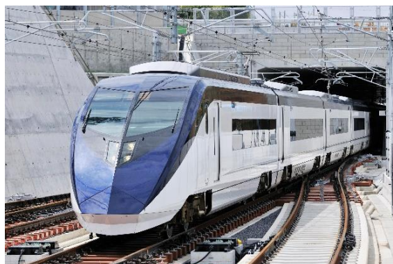
〈成田湯川付近を走行するスカイライナー〉

今回のダイヤ改正では、都心から成田空港間を運行する「スカイライナー」の大幅な増発を中心に成田空港アクセスの更なる利便性向上を図り、増加する成田空港をご利用になるお客様や、本年10月末から予定されている成田空港の運用時間延長に対応させ、より便利で快適にご利用いただけるようになります。