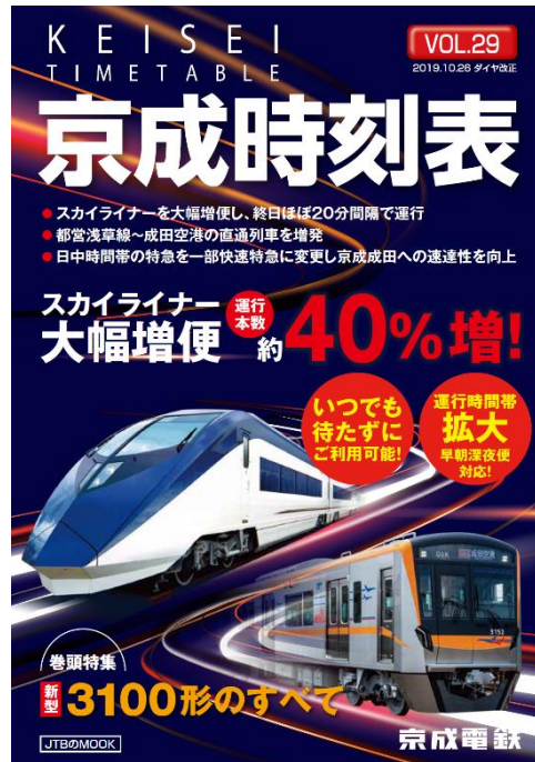
「京成時刻表 VOL.29」表紙(イメージ)