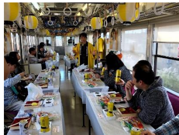
-昨年のビール列車の様子- 「ビールのおいしい飲み方講座」