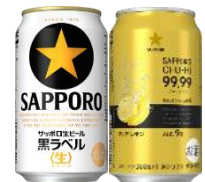
「サッポロ生ビール黒ラベル」と 「サッポロチューハイ 99.99」

当日は八千代台駅を出発し、3500形の臨時列車で東成田駅へ向かいます。車内では「サッポロ生ビール黒ラベル」と「サッポロチューハイ 99.99」を1本ずつご提供、前日も好評をいただいたサッポロビール社員による「ビールのおいしい飲み方講座」も開催。サッポロビール試供品のお土産も付いています。